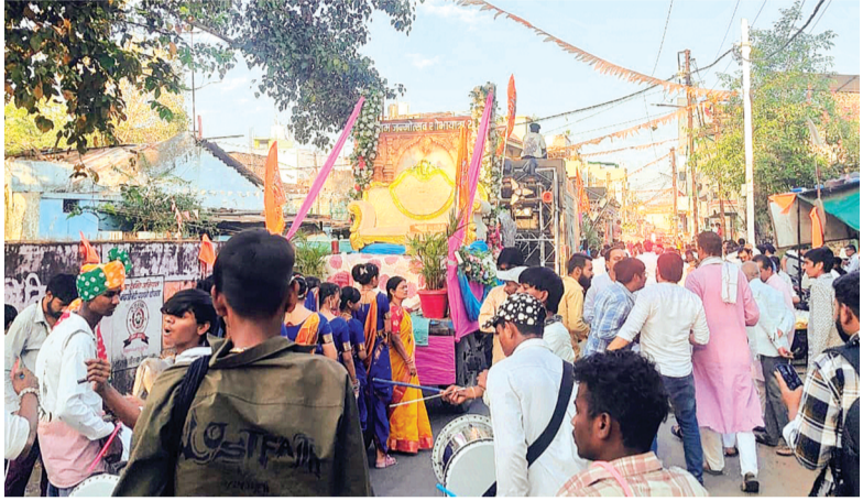
हरिभूमि न्यूज ▶▶हरदा

शुक्रवार शाम को रामनवमी के अवसर पर श्री हिन्दू उत्सव समिति ने प्रभु श्री राम की भव्य शोभायात्रा निकाली। यह शोभायात्रा संत रविदास चौक से शुरू होकर नगर के प्रमुख मार्गों से होते हुए परशुराम चौक तक पहुंची। इसका आयोजन श्री हिन्दू उत्सव समिति, विश्व हिंदू परिषद और बजरंग दल के संयुक्त तत्वावधान में किया गया है। शोभायात्रा में प्रभु श्री राम,