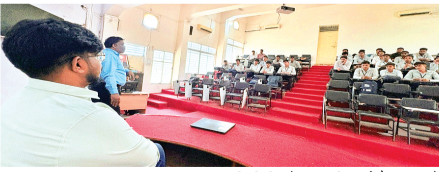
हरिभूमि न्यूज ▶▶हरदा

युवाओं को रोजगार के अवसर उपलब्ध कराने के उद्देश्य से 27 व 28 मार्च को पॉलिटेक्निक कॉलेज हरदा में डैकिन एसी कम्पनी की दो दिवसीय प्लेसमेंट ड्राइव का आयोजन किया गया। महाविद्यालय की प्राचार्य डॉ.