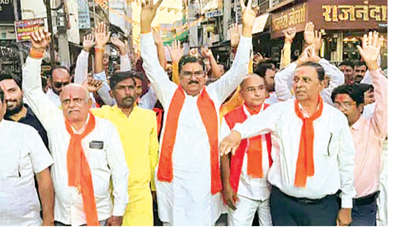
हरिभूमि न्यूज ▶▶हरदा

लक्ष्मण, जानकी, हनुमान जी, केवट और माता शबरी की झांकियां मुख्य आकर्षण का केंद्र रही। इनके अतिरिक्त, भजन-कीर्तन, ढोल-नगाड़े, अखाड़ों का शौर्य प्रदर्शन, संतों के रथ और सुसज्जित वाहन भी शामिल थे। रामनवमी के इस रविदास चौक से शुरू होकर नगर के प्रमुख मार्गों से होते हुए परशुराम चौक तक पहुंची। इसका आयोजन श्री हिन्दू उत्सव समिति, विश्व हिंदू परिषद और बजरंग दल के संयुक्त तत्वावधान में किया गया है। शोभायात्रा में प्रभु श्री राम,