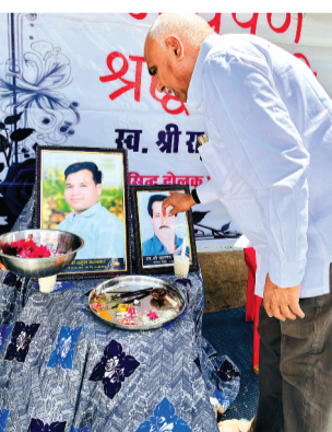
बेसहारा हुए परिवार का बने सहारा: